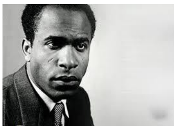
Франц Омар Фанон (1925-1961жж.) – әлеуметтік философ және психоаналитик.

Жаһандық ауқымдағы кедейшіліктің себептері әртүрлі. Кедейшіліктің және дамудың болмауының негізгі себептері, көбінесе, сан алуан және өте күрделі келеді. Мұндай себептерге географиялық оқшаулану, әртүрлі эпидемиялық ауру-сырқаттар, құрғақшылық, т.б. табиғи апаттардың нәтижелері, таза ауыз судың болмауы, жердің құнарсыздығы, физикалық инфрақұрылымның нашарлығы, білімнің болмауы, лайықты, денсаулық сақтау жүйесінің болмауы, азаматтық соғыстар, коррупция, сондай-ақ, колониализм мен сауда-саттықтың әділетсіз заңдарының таратылуы болуы мүмкін. Бір жағынан, нақ осы колониализм мәселесінің көп елдерде, әсіресе, Африка, Азия елдерінде көп елдердің экономикалық жағынан қалыс қалып отырғанының негізгі себептерінің бірі саналады. Осы пікірді алға тартушылардың бірі Франц Фанон Солтүстік африкалық интеллектуал.