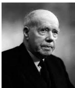
Сэр Уильям Дэвид Росс – этика мәселелерімен айналысқан шотланд философы (1877-1971 жж.)

Экологиялық этика туралы талқылауларда қолданылатын тағы бір термин – «prima facie құндылығы» (осыған дейінгі дәрістерде біз ол туралы айтқан болатынбыз). Уильям Дэвид Росстың айтуынша, «prima facie» «бір қарағанда», «алғашқы көзқараста» дегенді білдіреді.