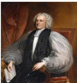
Джозеф Батлер (1692-1752жж.) – ағылшын философы-моралист.

Он сегізінші ғасырдың ұлы британдық моралисті, епископ Джозеф Батлер біздің пайымдауларымыздың дұрыстығына көз жеткізу үшін оларды жанымыз жай табатын «салқын талтүсте» ой елегінен өткізіп көруге кеңес бере отырып, бұған расымен де сенетіндей кеңес береді. Бәрі осыншалықты оңай ма?