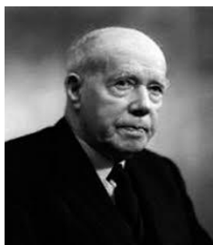
Сэр Уильям Дэвид Росс – этика мәселелерімен айналысқан шотланд философы (1877-1971 жж.)

Тағы бір нұсқа – ағылшын философы Уильям Дэвид Росстың prima facie (прима фаче), яғни «бір қарағанда көзге түсетін» міндеттерге қатысты тұжырымы. Росстың пікірінше, міндеттердің алуан түрі бар – олар төменде келтірілген.