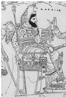
Дарий I – б.з.д. 522-486 жж. билік еткен Ахемендидтер әулетінен шыққан парсы патшасы.

Кітап: Этика: теориясы мен қазіргі мәселелері Дәріс: Этикалық реализм және этикалық плюрализм Дәріс атворы: Ақмарал Байдлаева