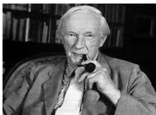
Джордж Эдвард Мур (1873-1958жж.) – ағылшын философы, философиядағы аналитикалық дәстүрдің негізін қалаушы.

Ал енді, бұл жағдайды этикаға байланысты ситуациямен салыстырып көріңіз. Егер мен Джон суға батқалы жатқан баланы құтқарды десем, менің моральдық пайымымның мақсаты қандай? Бұл әрекетте қандай да бір амалмен сезіп көруіме болатын нақты жақсылық фактісі бар ма? Мен Джонның баланы құтқару бойынша әрекеттерін, баланың, Джонның, көлдің және т.б. сипаттамаларын бақыласам болады. Бірақ егер жақсылықтың өзі бар болса, мен оны қандай мағынада ажырата аламын? Біз осыған дейінгі дәрістерде бірнеше рет есімін атап жүгінген британдық философ Джордж Эдвард Мур «жақсылық дегеніміз – адамдарға немесе әрекеттерге тән ерекше қасиет» деп санады.