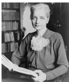
Рут Бенедикт (1887-1948жж.) – америкалық антрополог, америкалық антропологиядағы этнопсихологиялық бағыттың өкілі.

Дескриптивті релятивизмді растау үшін біз моральға қатысты мәдениеттердің кейбір айырмашылықтарын тізбектеп шықсақ болады. Кейбір қоғамдар жемқорлықты моральдық тұрғыда қолайлы санаса, басқалары оған айыппен қарайды. Сексуалды мінез-құлық пен практикаға келгендегі көзқарастар да сан алуан. Кейбір қоғамдар каннибализмді, адам егін жеуді пайдалы санап, ол тайпа ішіндегі бала тууға игі ықпал етеді немесе ер адамның қуатын арттырады дегенге сенеді. Солтүстік Канада мен Алясканың байырғы халықтары, инуиттердің кейбір топтары өздерімен көшіп-қонып жүруге шамасы келмей қалған қарт адамдарды тастап кету жөн десе, басқалары қарттарды өз балалары тұншықтырып, мертіктіруі тиіс деген жораны ұстанатын болған.