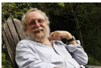
Майкл Рьюз (ағылш. Michael Ruse; 21 маусым 1940ж.) – ғылым философы. Көптеген ғылыми кітаптар мен мақалалардың авторы, Biology and Philosophy ғылыми журналының негізін қалаушы.

Объективистердің пікірінше, құндылықтардың объективті шындығы, түпнегізі бар, яғни олар – ақыл-парасатпен танып-білуге қолжетімді объектілер, ал субъективистердің ерекшелігі – олар құндылықты пайымдардың тек адам сезімдерімен танылатын субъективті пікірді білдіретінін айтып сендіреді. Платонның айтуынша, «Игілік» деп аталатын әлдебір ұғым немесе идея бар, ал біз адамгершілік туралы біздің субъективті моральдық пікірлерімізді осы объективті стандартпен салыстыра аламыз. Құдайдағы ізгілік болмысын дәлелдегісі келетіндерді объективистер деп атауға болады. Олардың қатарына денелердің табиғи немесе объективті ерекшеліктері мен олардың функцияларына баса назар аударатын табиғи құқық этикасының белгілі бір формасын қолдап-қорғайтындарды да жатқызуға болады. Бір қызығы, бұл мағынада социобиологияның ұстанымын объективистік деп атауға болмайды. Социобиолог моральға қатысты өз зерттеуін әлемнің объективті фактілеріне негіздейтініне қарамастан, ол моральдық пайымдаулардың өздерін моральдық фактілер деп санамайды. Бұған мысал ретінде социобиолог Майкл Рьюздың сөзін келтірейік.