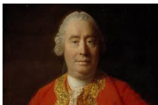
Дэвид Юм – шотландиялық философ, эмпиризмнің, психологиялық атомизм, номинализм мен скептицизм өкілі (1711-1776 жж.)

Сипаттаушы және нормативті ой-пайымдардың арасындағы айырмашылық - этика туралы толғаныстар үшін ең басты мәселелердің бірі. Әдеттегі ойлау жүйемізде біз бұл мәселелерді жиі шатастырамыз, бір жағынан, бұл біздің әдетте жасайтын нәрсемізді – жасауға тиіс нәрсе деп санайтынымызға байланысты. Адамдардың көбісі біз үшін бірдеңе әдеттегі нәрсе болса, біз мұны жасауға тиіспіз деп айтуға бейім болып, шатасады. Мысалы, егер ет жеу біз үшін әдеттегі нәрсе болса, демек біз ет жеуге тиіспіз. Бірақ вегетариандықтар мұнымен келісе қоймайды. Расында да, этикалық нәрсе мен табиғи немесе әдеттегі нәрсе арасында ешқандай міндетті бір байланыс жоқ. Осылайша, табиғи нәрсенің бәрі әрдайым жақсы деген сөз шындыққа ұласпайды. Бірақ адамдар жиі қателесіп, табиғи шындық пен құндылық тұрғысындағы пайымдауларын шатастырып жатады. Көбіне біз нақты нәрселерден құндылықтарға, яғни «бар немесе былай»-дан «болуы тиіс немесе міндетті» дегенге қалай өтетінімізге мән бермейміз. Он сегізінші ғасырдың философы Дэвид Юмның алға тартқан мысалын қарастырып көрелік.