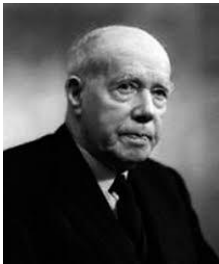
Сэр Уильям Дэвид Росс – этика мәселелерімен айналысқан шотланд философы (1877-1971 жж.)

Бірдеңені жақсы деп айту, көбіне, бірдеңені сары немесе ауыр деп айтқаннан өзгеше деп есептеледі. Соңғы аталған екі сапа: сары немесе ауыр - эмпирикалық, яғни біздің сезімдерімізбен қабылданатын сапалар. Алайда жақсы немесе игілік эмпирикалық емес қасиет болып саналады, оны, кейбіреулердің пікірінше, интуиция арқылы ғана тануға болады. Интуиционизм ретінде танымал ұстаным біздің этика туралы түсініктеріміз этикалық ақиқаттарды белгілі бір интуициялық тануға негізделеді деп сендіреді. Бұл көзқарас осыған дейін талқыланған Джордж Эдвард Мурдың есімімен байланысты. Тағы бір философ Уильям Дэвид Росстың пікірінше, біздің бойымызда негізгі құндылықтар туралы көптеген «мөлдір таза интуициялық түсініктер» бар. Бұл интуициялар этика туралы анық және айқын ұғымдарды білдіреді, оларды Росс математикамен салыстыра отырып, түсіндіреді: « 2 + 2 = 4 » сияқты өздігінен көрініп тұратын ақиқатты қалай көретін немесе интуициялық түрде ұғынатын болсақ, дәл сол сияқты біз этикалық ақиқаттарды да көреміз немесе интуициялық түрде ұғынамыз дейді ол.