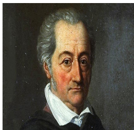
И. В. Гете