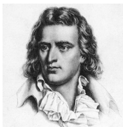
И. Ф. Шиллер

Дәріс: XIX ғасырдың тарихшылары мен философтары: тарих туралы түсінік