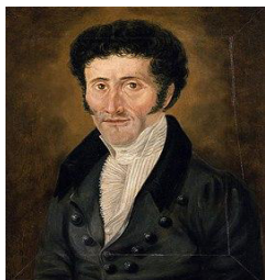
Э. Т. А. Гофман