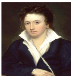
П. Б. Шелли