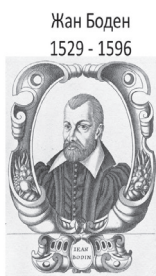
Жан Боден 1529 - 1596

Жаңа тарихи сананың қалыптасуына түрткі болған қоғамдық өмірдің барлық салаларындағы түбегейлі өзгерістер кезеңінде батыс еуропалық тарихының өтпелі дәуірінде өмір сүрген Франческо Патрици мен Жан Боденнің идеялары шынайы жаңашыл болды.