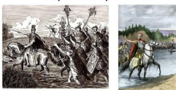
Войско Цезаря переправляется Через Рубикон. (49 г. до н. э.)

Б.з.б. 49 жылы Цезарьдің Рубиконды кесіп өтуі жеке факт ретінде қарастырыла алады, бірақ ол сондай-ақ көптеген шағын фактілерге бөлінеді.