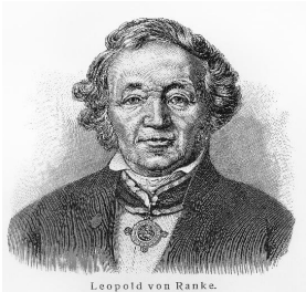
Leopold von Ranke.

Итак, пусть название курса так и останется парадоксальным. На протяжении этой и последующих лекций мы с вами поразмышляем над историей истории.