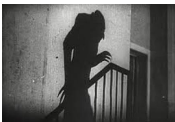
Бейнелерді көбейту: баспалдақтың көлеңкесі көрінетін, «Носфератудың» классикалық кадры.

Лотте Эйсер экспрессионизм кезеңіндегі неміс кинематографы баспалдақ бейнесіне әуес болғанын аңғарады. Осы бағыттағы барлық классикалық фильмдерде, кейіпкерлер баспалдақ айналасында қалатын сахналарды суреттеген. Бұл маңызды сәттерде ғана емес (Чезаре, Жаннаны ұстап алып, полициядан қашатын «Доктор Калигаридің кабинетінің» сахнасы), болмашы сахналарда да орын алған. Айталық, соңғы үнсіз экспрессионистік бағыттағы фильмдердің бірі «Асфальтта», бас кейіпкер сүйіктісімен жолығу үшін, үнемі баспалдақпен жоғары көтеріледі. Кінәны мойнына алып, полиция қолына берілген кезде, ол төмен қарай жүреді. Ал, баспалдаққа, өте қызықты, динамикалық тұрғыдан жарық түсірілген: жарық – кеңістікті қисық геометриялық фигураларға бөледі. Бұл әдісті әділетсіздік метафорасы ретінде қабылдауға болады: кейіпкер игі қадам жасағанда, ешкім, жалпы, қоғам (полицей бейнесі) оны арқасынан қақпайды (баспалдақпен төмен әкетіп барады).