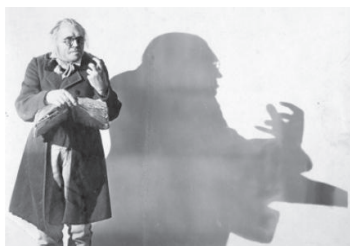
Доктор Калигари мен оның қорқынышты көлеңкесі.

Неміс экспрессионизмі фильмдері көлеңке бейнелеріне толы. Өйткені, а) олар ішкі күйзелістерге үңілген (жан нені сезінеді? Оның тәнмен ара-қатынасы қандай? Осы ара-қатынастың табиғаты қандай?) б) режиссерлер мистикалық құпия сырға толы сюжеттерді пайдаланып, ежелгі миф пен аңыздар әлеміне, о дүние тылсымына үйіріп әкетеді. Бұл әлем өте қорқынышты, оның байыбына жете алмайсың (вампирлер, елестер, қаныпезерлер, есалаңдар) в) сценаристтер зерттеу нысаны ретінде адам баласының психологиялық күйін алған (көне грек тілінен аударғанда «Психология» сөзі «жан туралы ілім» деген мағына береді).