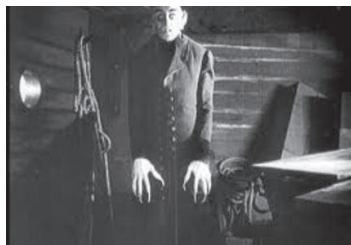
«Носфератудағы» граф Орлақтың жалғанбалы қолы.

Экспрессионистік актерлік ойынның тағы бір ажырамас кбөлшегі - қол. Неміс актерлерінің ишпарат мен көз пластикасы. Оның денесі қозғалыссыз деуге тұрарлық, әрекетін ол тек жанарымен және қол ишаратымен білдіреді.