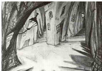
«Доктор Калигаридің кабинетінің» сценографиясы.

Декорацияға бөлек тоқталған жөн. Көптеген фильмдерде түсірілім алаңына қарасты ерекше шешімдер қабылданған. Ол заманда Германияны шарпыған ауыр экономикалық күйзелісті естен шығармаған абзал. Суреткерлер ойындағысын түгел жүзеге асыра алмаған себебі, продюсерлердің бұған қаражаты болмады. Қарабайырлық, нақтырақ айтқанда, декорацияны оңайлату амалы сондықтан орын алған. Әйтсе де, бұған қарап, олардың әсері төменді деуге келмейді. Сондықтан, «Доктор Калигаридің кабинеті» фильміндегі декорация балалар театрының картон декорациясына ұқсап кетеді. Бәрі өте қарапайым ғана, тегіс, ең бастысы, өз қолымен жасалған (тура баланың салған суретіндей) сәл немқұрайлық сезіледі, дегенмен, менің ойымша, бәрі өте көркем шықты.