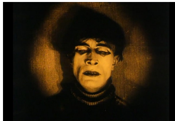
«Доктор Калигаридің кабинетіндегі» Чезаре-сомнамбула.

Неміс экспрессионизміндегі көркемдік құралдардың бірі актерлердің ишараты. Актер ойынын жіктесек, оның ішінде ең маңыздысы көзі мен көзқарасы болып шығады. Көрермен назары оның көзіне ауады. «Доктор Калигаридің кабинетінде» сомнамбуланың көзі үрей туғызады, бет-әлпетіндегі маска жанарының солғанын ерекшелеп тұрады. Бұл көзде кез-келген дүниені байқауға болады, өйткені, ол санасыз, оған есі ауысқан Калигари әмір жүргізеді. Назар аударарлығы, көргеніміздің бәрі Франц қиялы екенін түсінгенімізде, Чезаре бетіндегі, көзінің айналасындағы маска ғайып болып, жанарына жан бітеді.